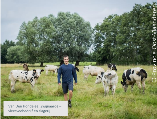
Van Den Hondelee, Zwijnaarde – vleesveebedrijf en slagerij