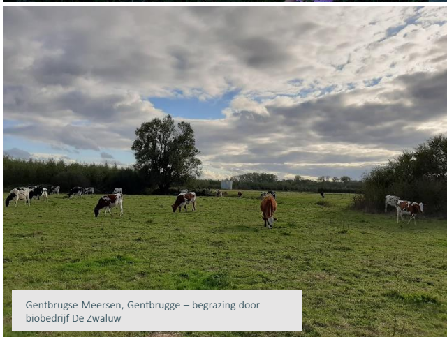
Gentbrugse Meersen, Gentbrugge – begrazing door biobedrijf De Zwaluw