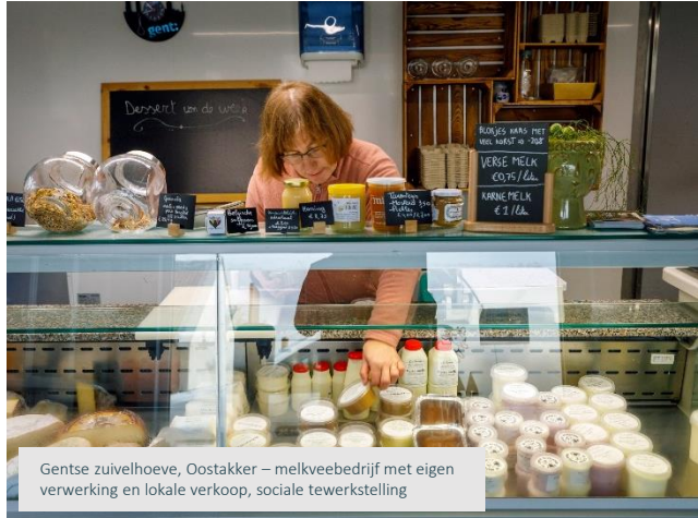
Gentse zuivelhoeve, Oostakker – melkveebedrijf met eigen verwerking en lokale verkoop, sociale tewerkstelling