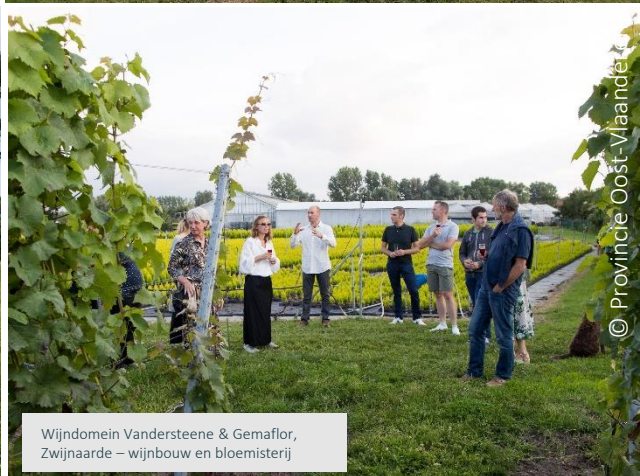
Wijndomein Vandersteene & Gemafior, Zwijnaarde – wijnbouw en bloemisterij