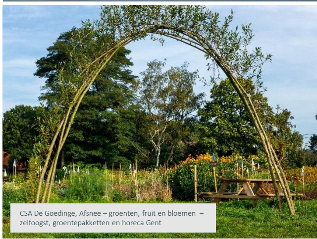
CSA De Goedinge, Afsnee – groenten, fruit en bloemen – zelfoogst, groentepakketten en horeca Gent