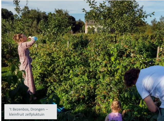
't Bezenbos, Drongen – kleinfruit zelfpluktuin