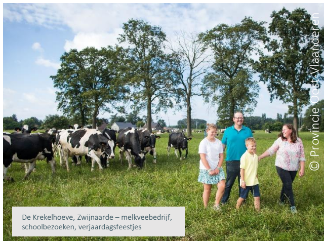
De Kregelhoeve, Zwijnaarde – melkveebedrijf, schoolbezoeken, verjaardagsfeestjes