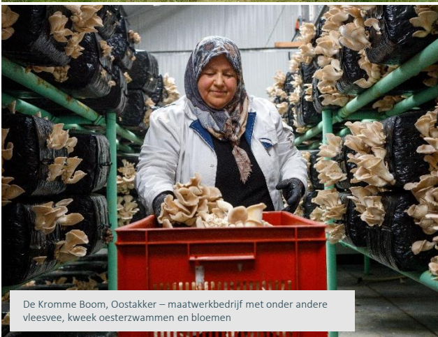
De Kromme Boom, Oostakker – maatwerkbedrijf met onder andere vleesvee, kweek oesterzwammen en bloemen