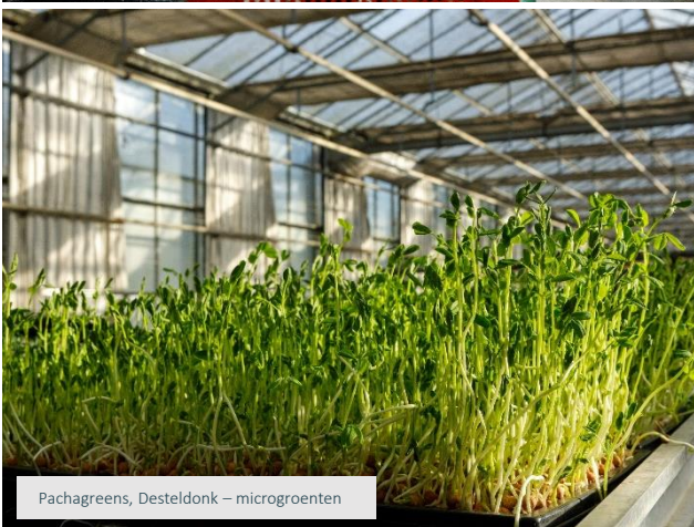
Pachagreens, Desteldonk – microgroenten