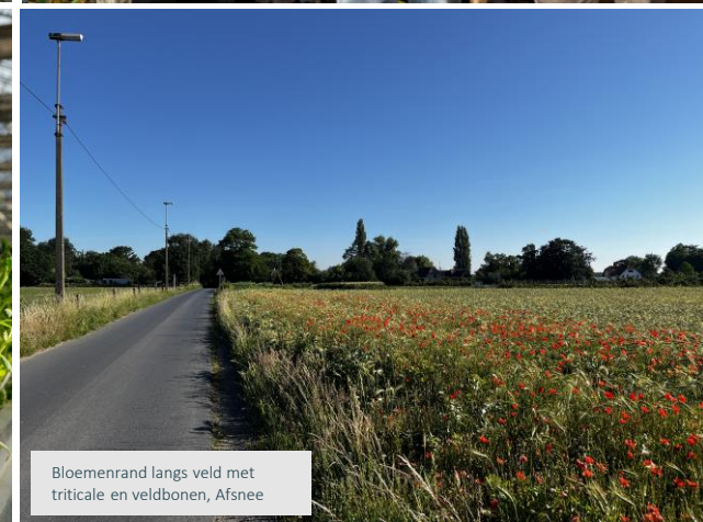
Bloemenrand langs veld met triticale en veldbonen, Afsnee