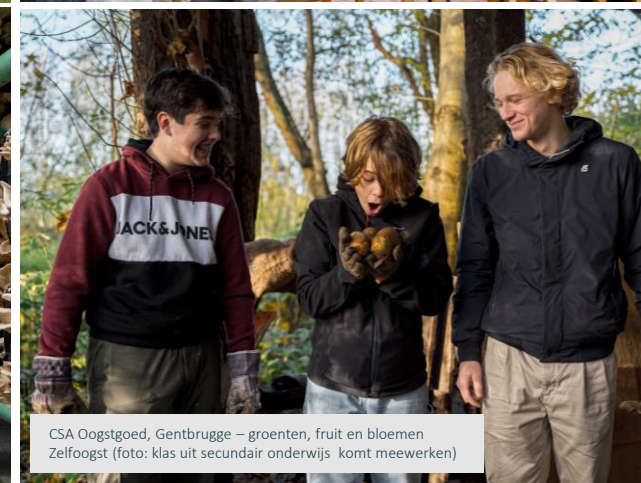
CSA Oogstgoed, Gentbrugge – groenten, fruit en bloemen Zelfoogst (foto: klas uit secundair onderwijs komt meewerken)